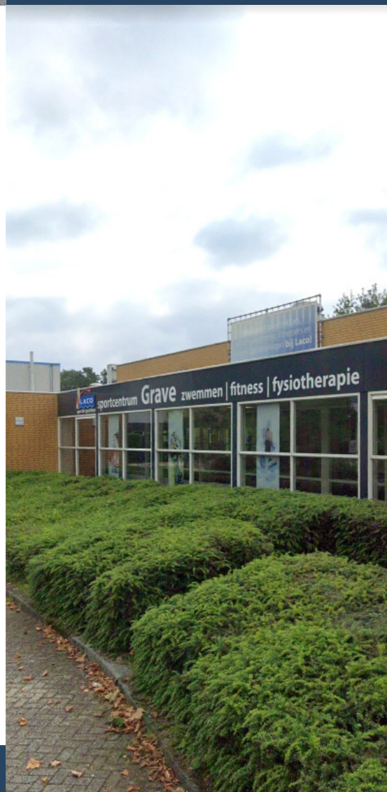
SPORT & RECREATIE

Voor kinderen in de basisschoolleeftijd is er binnen de wijk best veel te doen. Voor jongeren (12-18) daarentegen valt er nog veel winst te behalen. Het creëren van een ontmoetingsruimte voor de groep zou een goede start kunnen zijn. Als we daar meer op inzetten, dan draagt dat mogelijk ook bij aan het terugdringen van overlast.